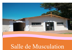
Salle de Musculation